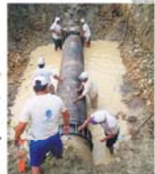
Trabajadores reparando tuberías de agua potable en Machala.

El suministro de agua potable en Machala se prevé reanudar mañana, tras un corte de servicio que duró varias horas. El suministro de agua potable en Machala se prevé reanudar mañana, tras un corte de servicio que duró varias horas. El suministro de agua potable en Machala se prevé reanudar mañana, tras un corte de servicio que duró varias horas.