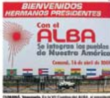
Caracas, 14 de abril de 2008. El presidente del ALBA, Hugo Chávez, en un momento del evento.

El ministro de Política Económica, Diego Rúa, que se reúne con empresarios en Caracas, dijo que el Sucre del ALBA no altera el comercio. Rúa dijo que el Sucre del ALBA es una propuesta para evitar el dólar como unidad de cuenta de la región.