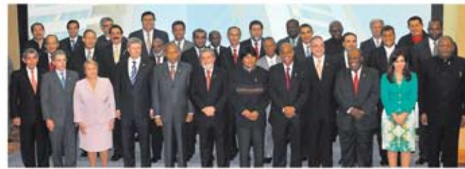
Barack Obama (2) en un momento del encuentro con líderes de la región en la Casa Blanca.

Manifestación de EE.UU. recordó uno por uno a los presidentes sudamericanos.