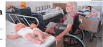
Ayuda social: una persona en silla de ruedas es asistida por otra persona.

Ayuda social El miércoles se realizará la colecta pública de la Casa del Hombre Doliente, una institución que brinda atención médica y psicológica a personas con discapacidad. El miércoles se realizará la colecta pública de la Casa del Hombre Doliente, una institución que brinda atención médica y psicológica a personas con discapacidad. El miércoles se realizará la colecta pública de la Casa del Hombre Doliente, una institución que brinda atención médica y psicológica a personas con discapacidad.